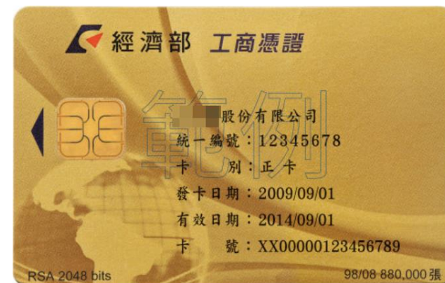
▲經濟部工商憑證示意圖